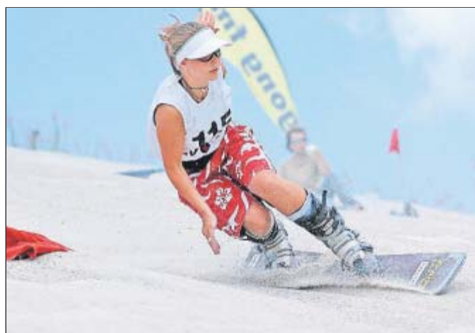
Cooler Moves auf heißem Sand: Vom 12. bis 15. Juli steigt am Monte Kaolino nahe Hirschau bei Amberg die 16. Sandboarding-WM.

pionships lockten in den vergangenen Jahren jeweils bis zu 12000 Besucher und bis zu tausend Journalisten auf das Gelände am „weißen Riesen“.