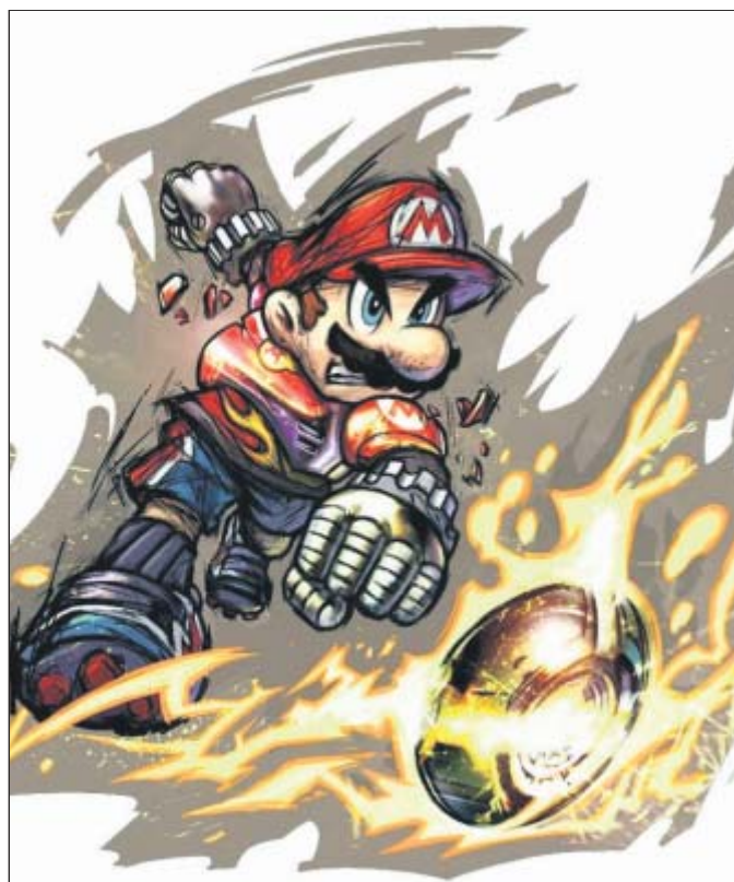
Bei „Mario Strikers: Charged Football“ geht es nicht um Fairplay.