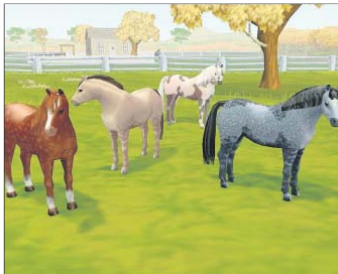
„Pony Friends“ heißt die Haustier-Simulation für Pferdenarren.

alle Hindernisse. Als Belohnungen winken Boni wie neue Charakter, hippe Klamotten, Videoclips und Musiktitel.