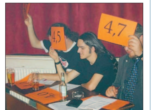
Jury der Nord-Rheinland-Pfalz-Meisterschaft.

Das Instrument eines Luftgitarrenisten muss aus Luft bestehen, also unsichtbar sein. Persönliche Luftrodies, die beim Transport des Instruments helfen, sind erlaubt. Die Begleitung durch eine Band – real oder aus Luft – ist unzulässig. Gespielt werden kann die akustische oder die E-Gitarre, oder aber auch beide. Auch beim Outfit für den Auftritt gibt es keine Beschränkungen, allerdings sollten die Teilnehmer mindestens 16 Jahre alt sein. Zwei Runden werden ausgetragen: Kür und Pflicht. In der ersten tragen die Teilnehmer ein frei gewähltes Stück 60 Sekunden lang vor, die Musik für den Pflichtteil bestimmt der Veranstalter. Allen Teilnehmern wird das Pflichtstück vor dem Auftritt einmal vorgespielt. Die Jury bewertet die beiden Auftritte nach folgenden Kriterien: Originalität der Leistung, Ausdrucksfähigkeit hinsichtlich der musikalischen Botschaft, Charisma, technische Fähigkeiten, künstlerischer Gesamteindruck und Luftigkeitstauglichkeit, was die Fachleute auch als so genannte „Airness“ bezeichnen. Die Bewertung orientiert sich an denen des Eiskunstlaufens. Jedes Jurymitglied gibt ein Votum auf einer Skala von 4,0 bis 6,0 ab. Wer in der Summe der beiden Teile Pflicht und Kür die meisten Punkte hat, entscheidet den Wettkampf für sich.